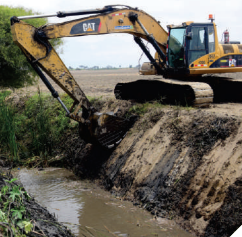
Excavadora ejecuta mantenimiento de Canal de Derivación Cao