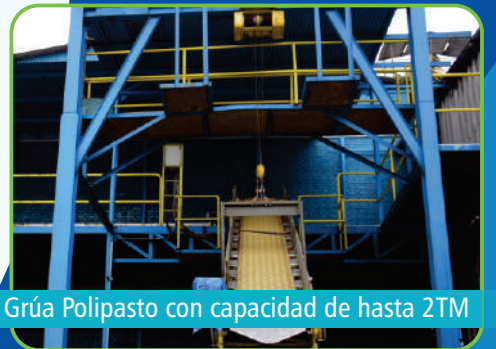
Grúa Polipasto con capacidad de hasta 2TM