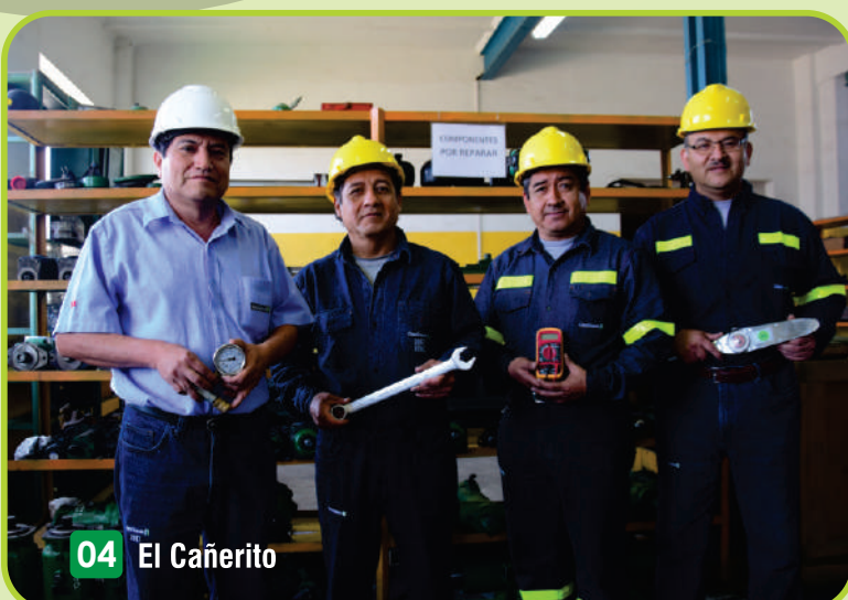
04 El Cañerito

Comprometidos con la optimización de nuestros recursos, el Taller Mtto. de Maquinaria Pesada y Agrícola implementó una sala de recuperación y reparación de componentes hidráulicos y eléctricos, donde los técnicos - conocedores y experimentados - realizan sus labores de manera eficiente.