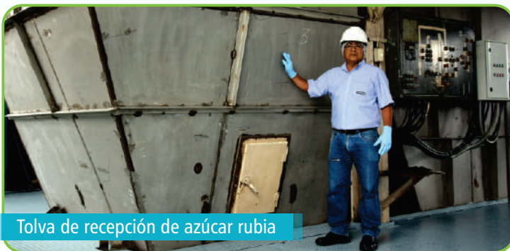
Tolva de recepción de azúcar rubia