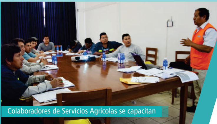
Colaboradores de Servicios Agrícolas se capacitan

Durante 8 sesiones, los colaboradores de Servicios Agrícolas aprendieron sobre aire acondicionado para ser aplicado en maquinaria pesada y vehicular.