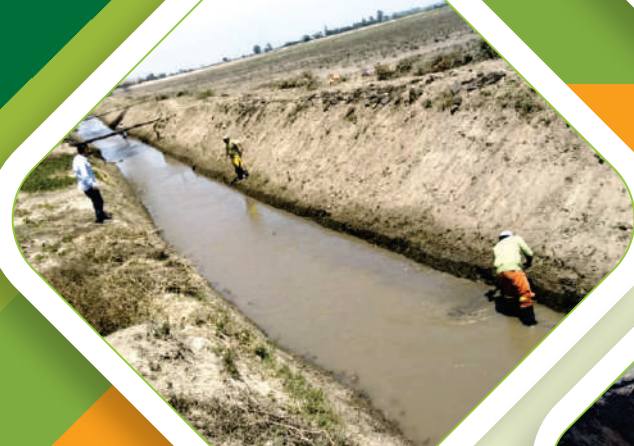
Trabajos de mantenimiento en el Canal de Derivación Plan