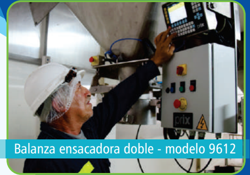
Balanza ensacadora doble - modelo 9612

De esta manera, avanzamos en la implementación de esta tercera línea, la cual nos permitirá aumentar la productividad en el área de Secado y Envasado, asegurando la entrega de un producto final que cumpla los parámetros de calidad e inocuidad que el mercado nos exige.