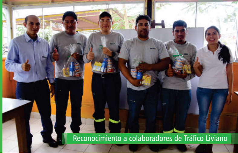
Reconocimiento a colaboradores de Tráfico Liviano

Por su parte, los supervisores y jefes felicitaron a sus colaboradores por la entrega y compromiso demostrado, y motivaron a todo su equipo a seguir esforzándose en el ejercicio de sus labores.