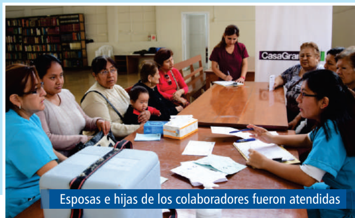
Esposas e hijas de los colaboradores fueron atendidas